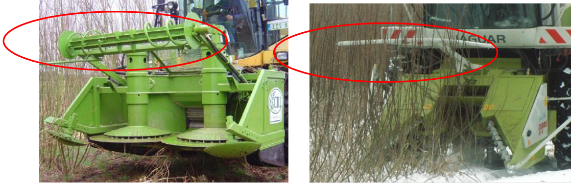
Rys. 3. Przystawki do zbioru pędów z oznaczonymi nagarniaczami: a – układ aktywny, b – układ bierny

W związku z powyższym można stwierdzić, że maszyny do zbioru pędów wierzby wyposażone w nagarniacze (rys. 3a i b) pracujące na wysokości 2 m powinny posiadać szerokość nie mniejszą niż 3,3 m. Wraz z obniżaniem wysokości pracy tych systemów maleje szerokość robocza, np. na wysokości 1 m maksymalna szerokość pracy przystawki powinna wynosić około 2,8 m.