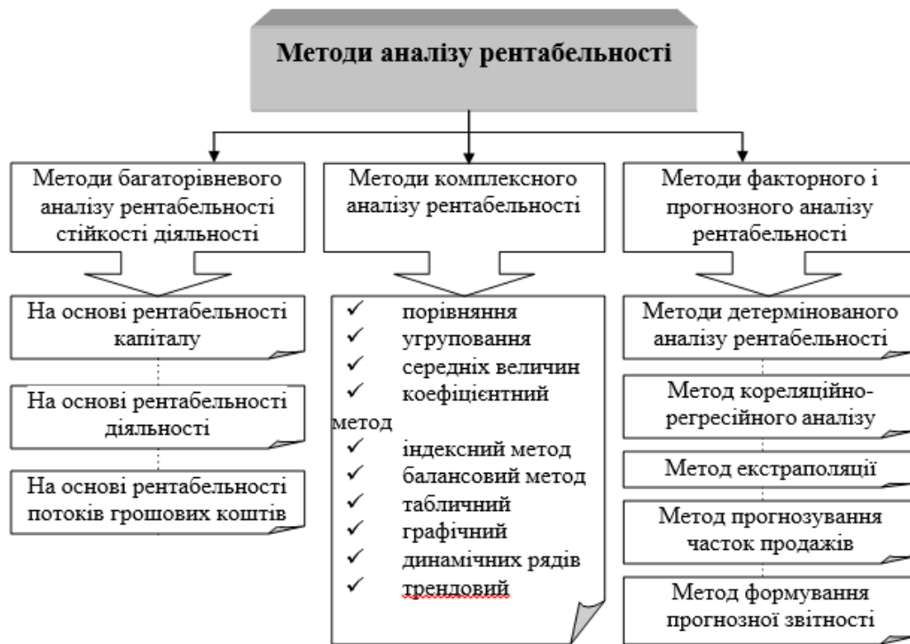
Рис. 1. Рекомендована класифікація методів аналізу рентабельності в рамках реалізації системного підходу

Для того, щоб висновки і пропозиції мали практичну і методичну значимість на усіх рівнях управління економікою і носили дієвий характер, необхідно вибирати комплекс методів і процедур, що відповідають поставленим цілям, завданням і технічному інструментарію. З цією метою запропоновано угруповання методів аналізу і прогнозування рентабельності (рис. 1).