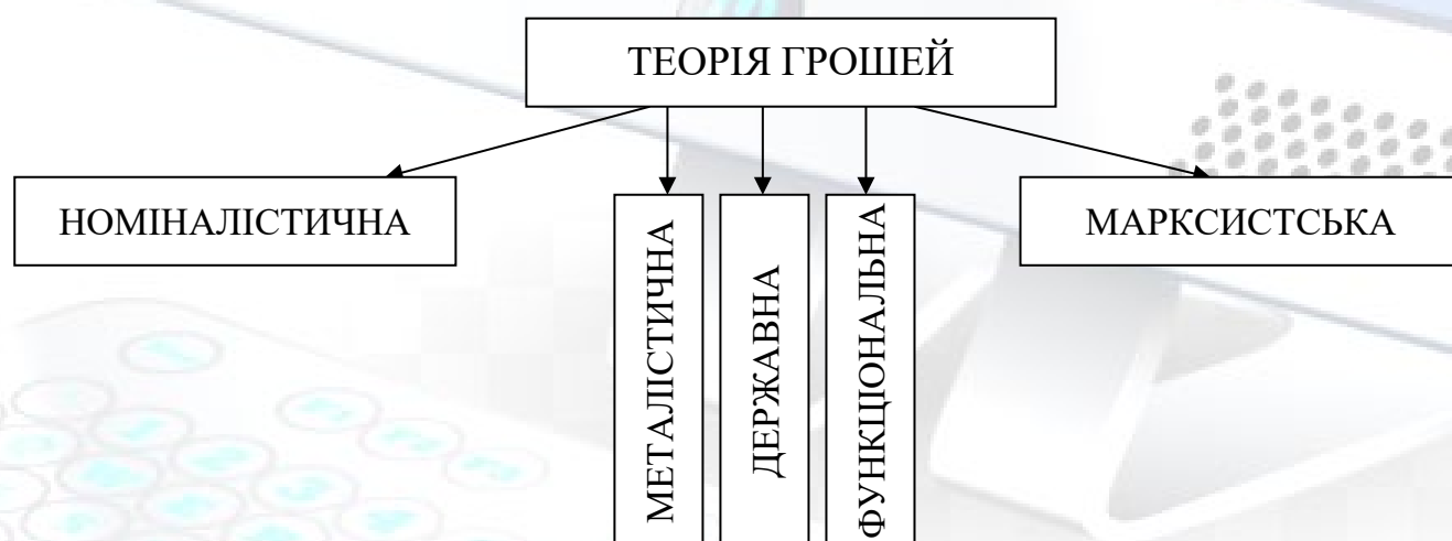
Рис. 1.1. Прояви підходу до абстрактної теорії грошей [1].

У світовій економічній науці чітко виділяється два підходи до вивчення теоретичних проблем грошей. Представники одного з них шукають відповіді на питання пов'язані з внутрішньою природою грошей. Для цього напрямку в теорії грошей характерне явне перебільшення уваги до внутрішніх аспектів явища грошей і недооцінка їх зовнішніх аспектів, що проявляються у впливі грошей на економічні процеси. Цей підхід, щодо вивчення природи грошей, називають абстрактною теорією грошей. Найбільш відомими проявами такого підходу є номіналістична теорія, металістична теорія, державна теорія, функціональна теорія, марксистська теорія та інші. Прояви підходу до абстрактної теорії грошей запропоновано на рис. 1.1.