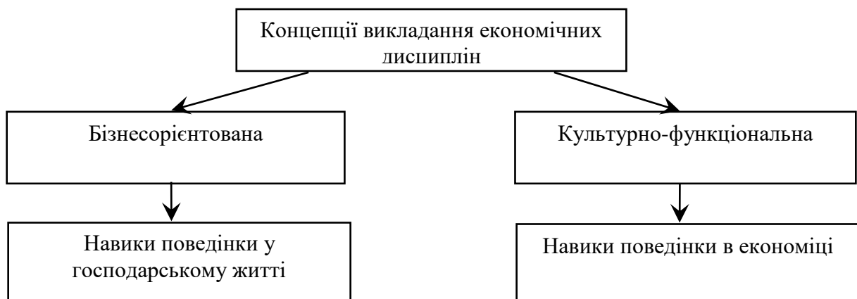
Рис. 2. Концепції викладання економічних дисциплін

Під час викладання економічних дисциплін сьогодні реалізуються дві концепції викладання: бізнесорієнтована та культурно-функціональна (рис. 2) [1]. Завдяки даним концепціям студенти спрямовані на вироблення навиків поведінки у господарському житті та отримують загальні уявлення про світ економіки, відповідних цінностей, а на їхній базі – навиків поведінки в економіці.