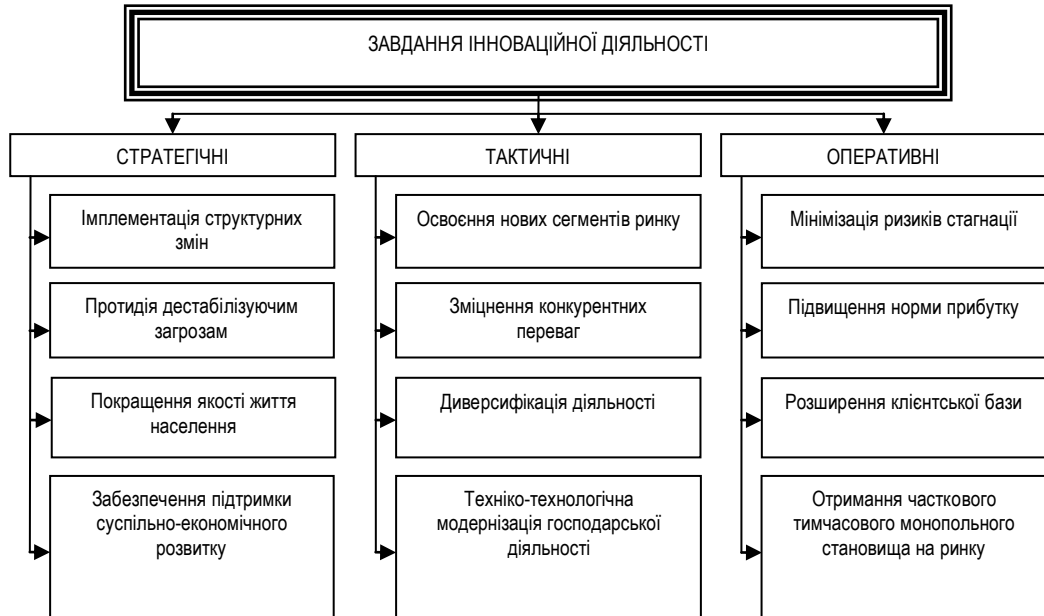
Рис. 1. Структуризація завдань інноваційної діяльності*

стратегічну роль у розрізі всіх сфер суспільно-економічного життя. Важливе місце інноваційна діяльність посідає й у функціонуванні підприємств туристичної галузі, що обґрунтовується не лише потребою в постійному вдосконаленні існуючих технологій задоволення вподобань і потреб споживачів туристичних послуг, але й доцільністю пошуку якісно нових підходів до максимізації отриманого прибутку туристичними підприємствами.