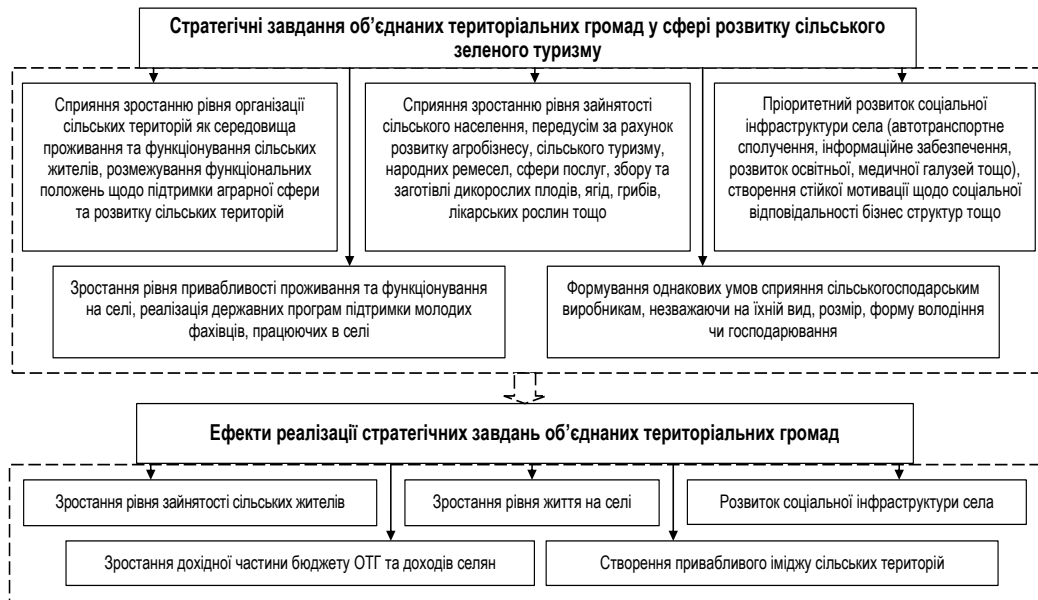
Рис. 1. Стратегічні завдання об'єднаних територіальних громад у сфері розвитку сільського зеленого туризму*

Тож, підсумовуючи все вищезазначене та зважаючи на Державну стратегію регіонального розвитку до 2020 року, варто виокремити низку першочергових стратегічних завдань, необхідних для реалізації об'єднаними територіальними громадами задля розвитку та ефективного функціонування сільського зеленого туризму, які в підсумку також сприятимуть сталому розвитку сільських територій (рис. 1).