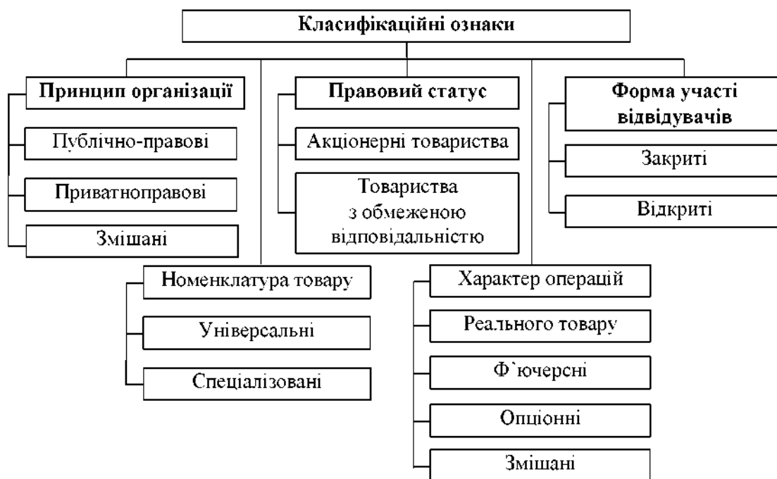
Рис. 3. Класифікація бірж