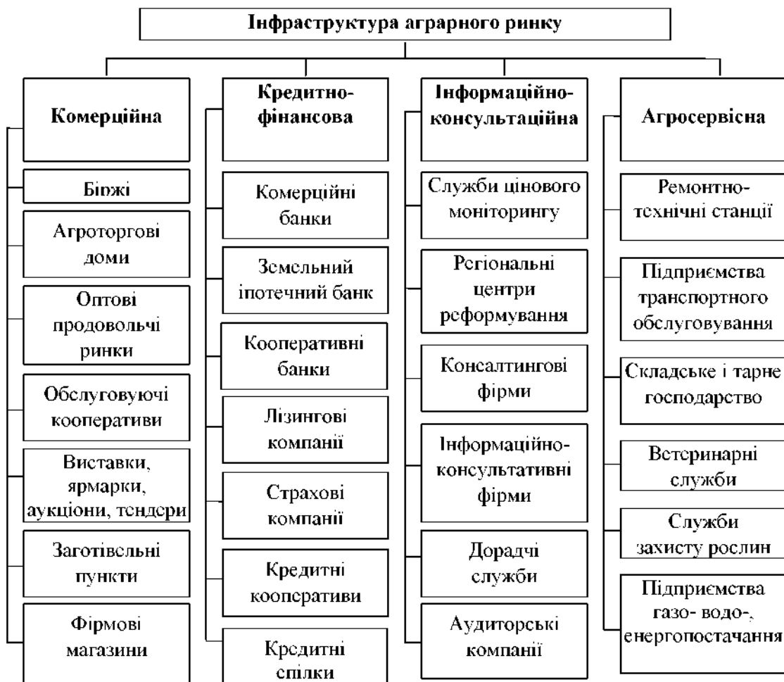
Рис. 2. Складові й елементи інфраструктури аграрного ринку