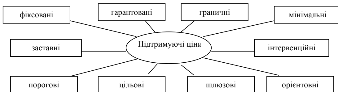
Рис. 2. Класифікація підтримуючих цін

Розглянемо представлені різні види підтримуючих цін, які використовуються у вітчизняній та світовій практиці. Як бачимо, до таких цін відносять: фіксовані, гарантовані, граничні, мінімальні, заставні, інтервенційні, порогові, цільові, шлюзові, орієнтовні.