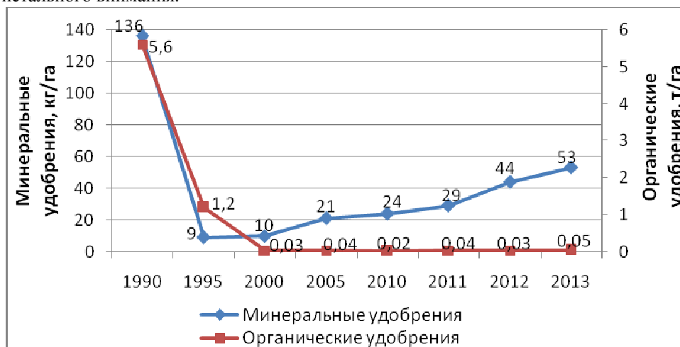
Рис. 2. Внесение минеральных и органических удобрений в среднем на 1 га посева в сельскохозяйственных предприятиях Республики Молдова за 1990-2013г.г.

При этом, несмотря на положительную тенденцию увеличения доз внесенных минеральных удобрений с 2000г., все же ситуация требует пристального внимания.