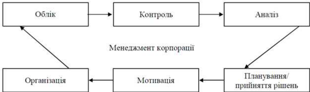
Рис. 2 Цикл задач управління корпорацією

Систему обліково-аналітичного забезпечення слід розглядати як сукупність підсистем обліку, аудиту та аналізу, які взаємодіють через інформаційні потоки в процесі створення та передачі оперативної та якісної обліково-аналітичної інформації для забезпечення прийняття обґрунтованих та ефективних управлінських рішень у системі управління корпорацією, а також зовнішніми користувачами. Цикл управління корпораціями є замкненим (рис. 2), тобто таким, що повторюється. В ньому обліково-аналітичні функції найважливіші, відсутність призводить до розриву управлінського циклу і значного зниження ефективності системи менеджменту.