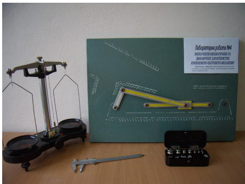
Рис. 2. Приклад професійно-спрямованої лабораторної роботи

Особливу групу завдань склали завдання з формування у студентів технічної компетенції під час виконання практичних та лабораторних робіт (рис. 2).