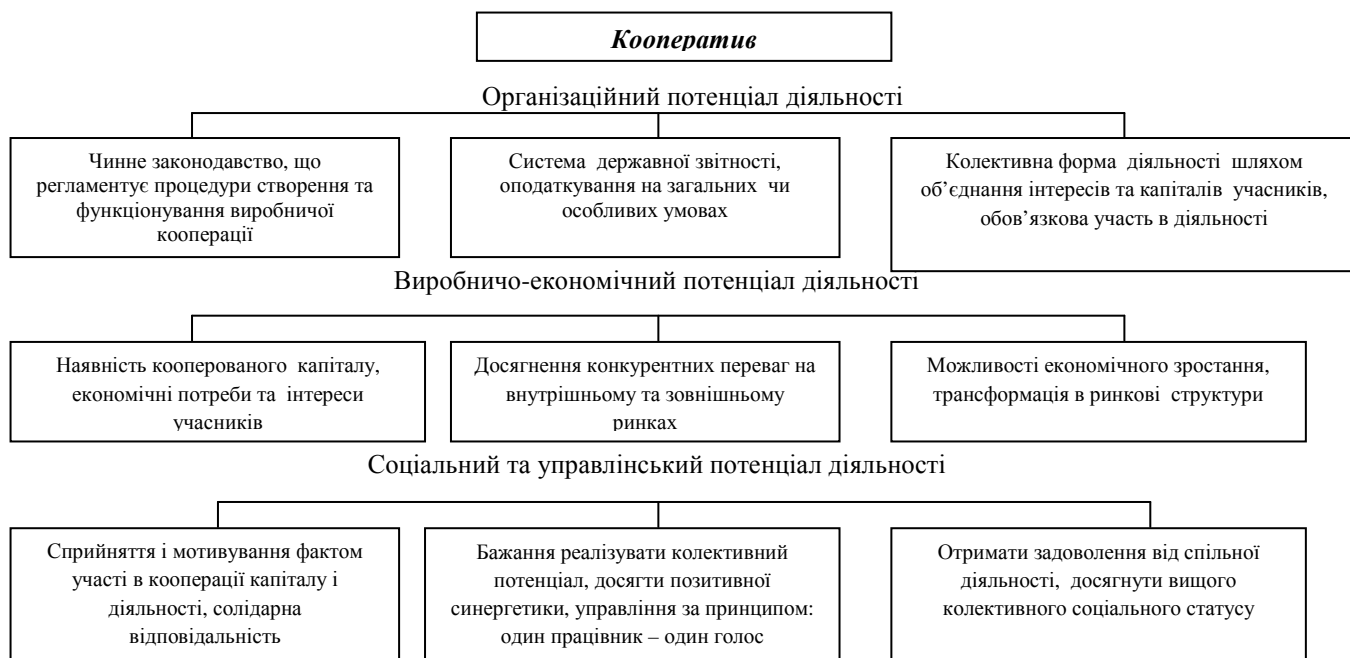
Рис. 1. Структурування ресурсних потенціалів виробничого кооперативу