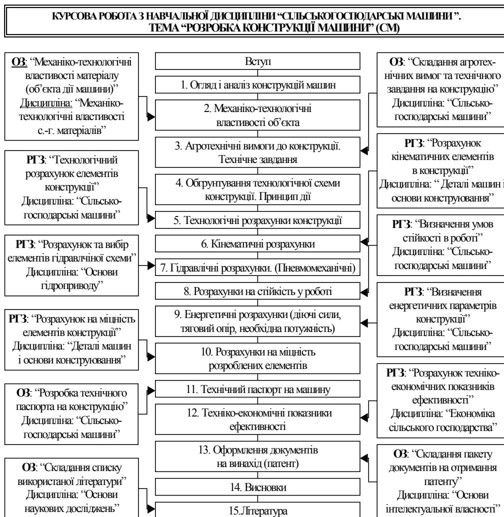
Рис. 3. Наскрізна схема виконання курсової роботи із дисципліни «Сільськогосподарські машини» (приклад)

Отже, педагогічна модель інтеграційно-наскрізного освітнього простору повинна включати комплекс умов, спрямованих на розвиток умінь студента застосовувати в більшій чи меншій мірі знання з різних навчальних дисциплін в майбутній професійній діяльності. Розвинути ці вміння в рамках навчально-пізнавальної діяльності можна лише при виконанні спеціальних дидактичних умов, наприклад, коли студент застосовує знання з дисципліни, по-перше, у процесі її вивчення - до об'єктів, зв'язаних з майбутньою професійною діяльністю; по-друге, при вивченні інших дисциплін - у нових, "вилучених" від цієї дисципліни, ситуаціях.