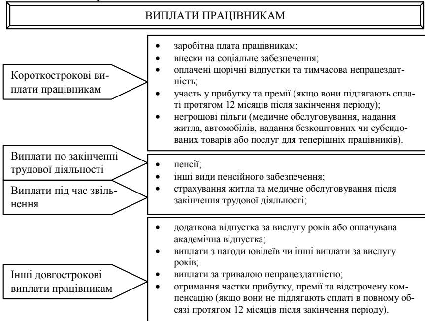
Рис. 1. Структура виплат працівникам підприємств відповідно до МСБО 19 «Виплати працівникам»

роботу, обчислюються за теперішньою вартістю з використанням ставки дисконту.