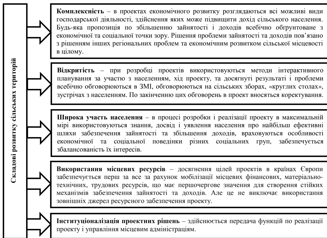
Рис. 1. Основні акценти економічного розвитку сільських територій в розвинених країнах Європи