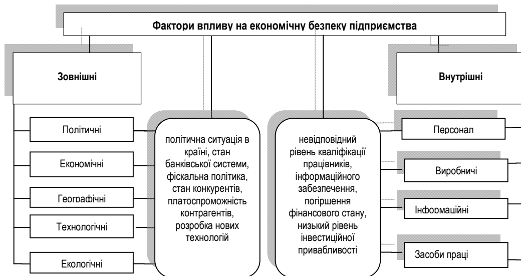
Рис. 1. Фактори впливу на економічну безпеку підприємства*

(ті, що впливають на усі її складові, на декілька складових і одну складову); за моментом виникнення (актуальні та потенційні); за сферою виникнення (правові; економічні; політичні; екологічні; соціальні; науково-технічні; технологічні; демографічні); за характером прояву (закономірні та випадкові) [7]. Найбільш поширені ризики залежно від сфери виникнення – зовнішні і внутрішні (рис.1).