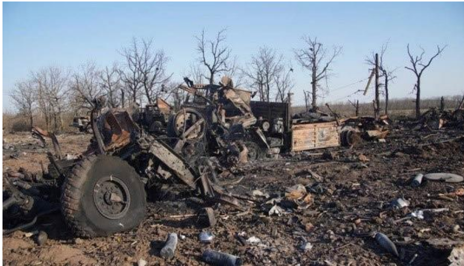
Рис.2 Приклад комплексного воєнного впливу, спричиненого вибухами боєприпасів та забрудненням рештками транспорту, пального і вибухівки.

застарілих ракет та реактивних снарядів, які масово застосовують окупаційні війська [2].