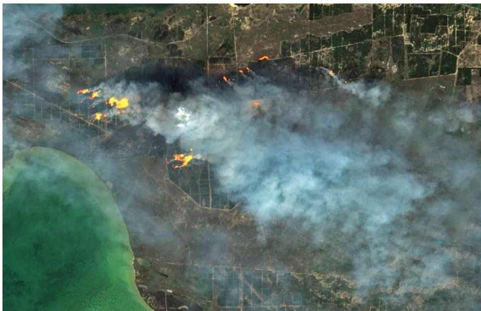
Рис.1. Лісові пожежі на Кінбурнській косі у вересні 2022 року.

такі пожежі охопили близько 2,4 млн гектарів, включно з 330 тис. га лісового фонду. Зокрема, згоріли тисячі гектарів лісу в національних природних парках «Кремінські ліси», «Святі гори», «Білобережжя Святослава», Чорнобильському біосферному заповіднику [1].