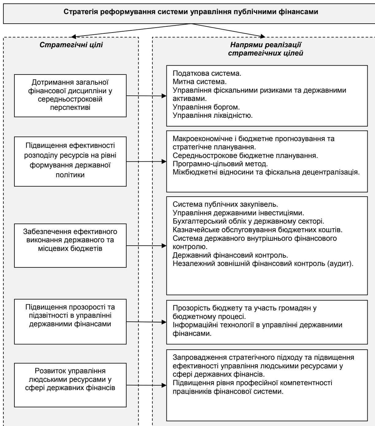
Рис. 2. Взаємозв'язок між стратегічними цілями та напрямками реалізації Стратегії реформування системи управління публічними фінансами