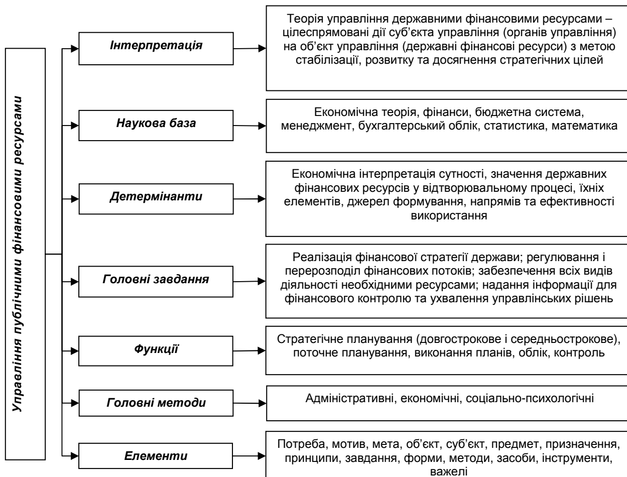
Рис. 3. Структурно-логічна схема управління державними фінансовими ресурсами

Важливим стратегічним напрямом є середньострокове бюджетування, яке дає можливість створити надійні середньострокові рамки для планування показників бюджетів усіх рівнів, руху державних фінансових ресурсів, значно підвищити рівень державної фінансової дисципліни, мінімізувати негативний вплив зовнішніх і внутрішніх фінансових загроз, фінансових ризиків та стан фінансової безпеки суб'єктів фінансових відносин у суспільстві.