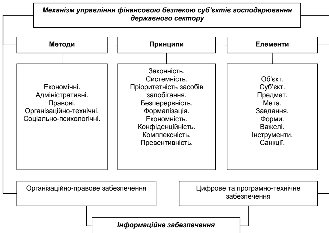
Рис. 4. Механізм управління фінансовою безпекою суб'єктів господарювання державного сектору

Управління фінансовою безпекою здійснюється за допомогою певного механізму, який передбачає використання свого інструментарію, зокрема методів, принципів, елементів, організаційно-правового забезпечення, цифрового та програмно-технічного забезпечення тощо. Цей механізм представлений на рис. 4.