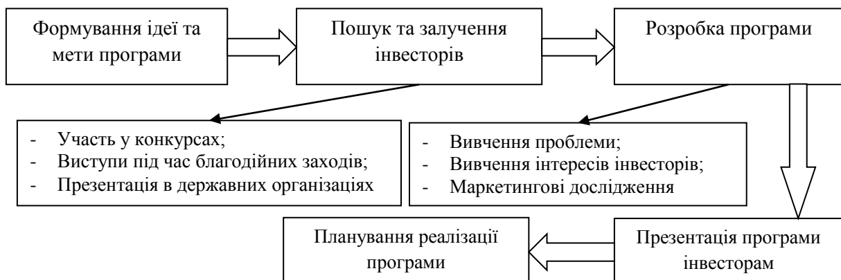
Рис. 4. Алгоритм розробки програми відновлення й розвитку сільських територій

У програмі мають бути вирішені соціально-економічні проблеми, культурні, ментальні, побутові, екологічні, проблеми освіти та місцевого самоврядування. Потрібно звертати увагу на особливості тієї території для якої розробляється програма, на її населення та їх проблеми, ментальність і традиції, наявність ресурсів і екологічний стан, можливість диверсифікації сільського господарства завдяки переробці та виробництву товарів із сільськогосподарської сировини, можливість розвитку сільського зеленого туризму, сільськогосподарських кооперативів та кластерів, що в свою чергу призводитиме до сталого розвитку та відновленню сільських територій.