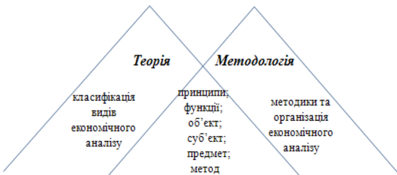
Рис. 2. Структурні елементи теорії та методології економічного аналізу

Структурними елементами (компонентами) методології економічного аналізу є: функції, принципи, предмет, об'єкт, суб'єкт, метод. Ці елементи з повним правом можна віднести і до теорії економічного аналізу, оскільки методологія – це теорія в дії. Таким чином, у спільній для теорії і методології економічного аналізу площині, знаходяться функції, принципи, предмет, об'єкти, суб'єкт і метод (рис. 2). Класифікація видів – це прерогатива теорії економічного аналізу, а методики та організація – сфера його методології. Відповідно, зміна парадигми потребує уточнення та доповнення структурних елементів теорії і методології економічного аналізу у контексті їх відповідності сучасним реаліям господарювання.