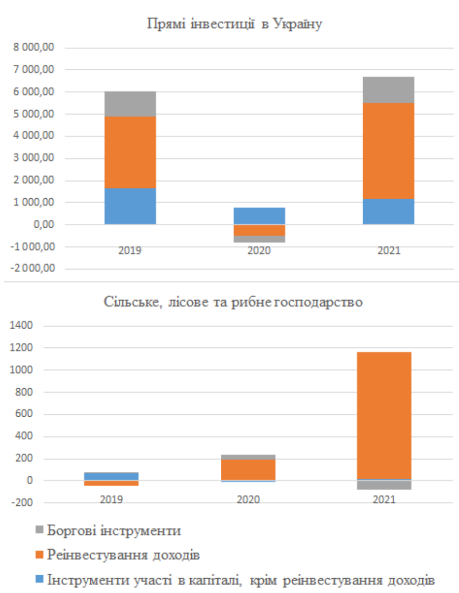
Рис. 1 Прямі іноземні інвестиції за інструментами, млн. дол. США