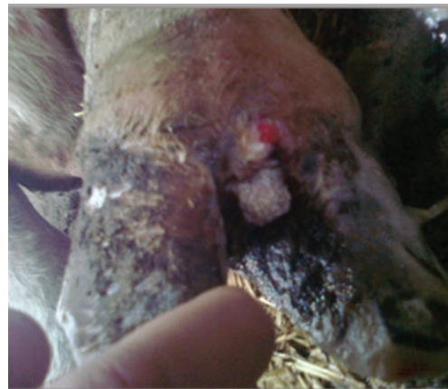
Рис. 1. Ураження копита за фузобактеріозу