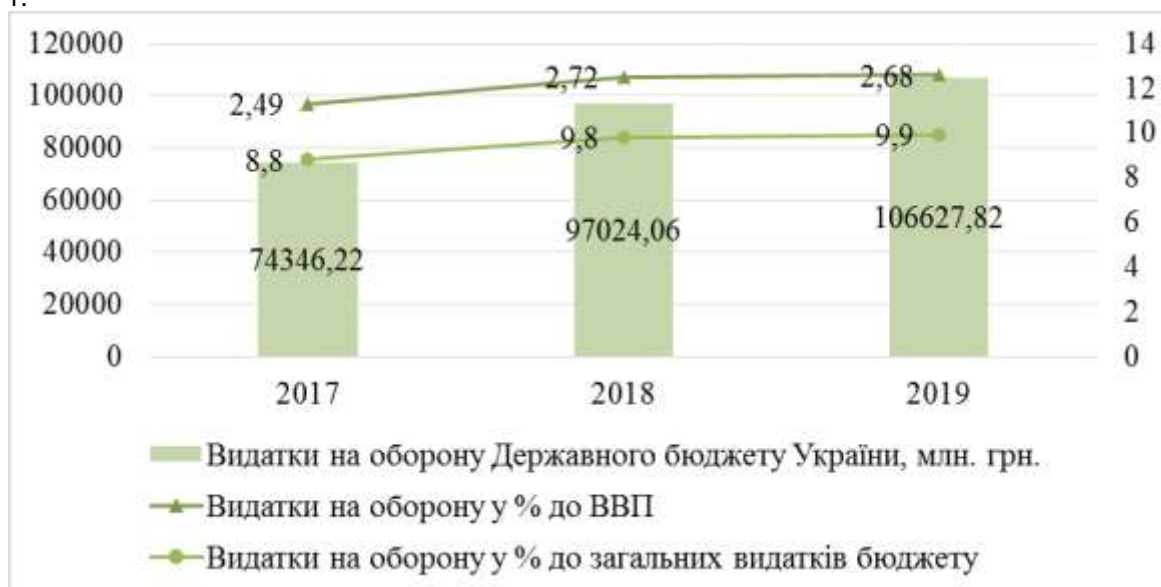
Рис. 1. Динаміка видатків державного бюджету на оборону за період 2017–2019 рр., млн грн

Показники, які відображають динаміку видатків на оборону за період 2017–2019 рр., подано на рис. 1.